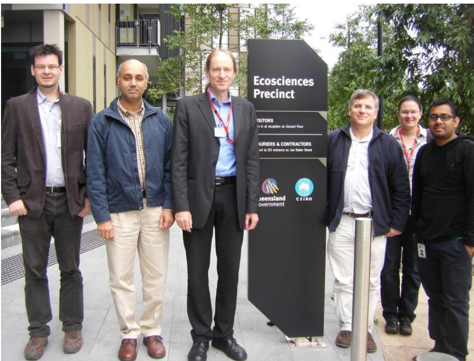
Treffen der Projektpartner

Die im Rahmen von diesem Forschungsvorhaben gewonnenen Erkenntnisse sollen regelmäßig vorgestellt werden. Zum einen werden Interessierte über die Homepage des TZW über das Projekt informiert und zum anderen sind Veröffentlichungen in nationalen und internationalen Fachzeitschriften vorgesehen. Außerdem wird das Projekt in Fachveranstaltungen am TZW und in Informationsveranstaltungen der Öffentlichkeit vorgestellt. Die im Rahmen des Vorhabens entwickelten Strukturen stärken die Kompetenzen der Partner und stehen anschließend für die praktische Umsetzung sowie für neue Forschungs- und Entwicklungsprojekte auf internationaler Ebene zur Verfügung.